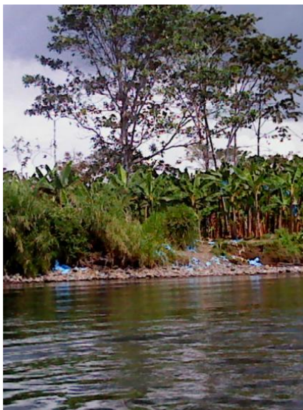
Figura 1: Lugar de acopio de plátano en la orilla del río Telire.

En las comunidades y fincas cuyo acceso es solamente por bote, pudo observarse 18 sitios de acumulación de bolsas plásticas en la orilla de ríos o quebradas (véase figura 1). La mayoría de estos sitios contaba con el riesgo de que las bolsas pudieran ser arrastradas por la corriente en caso de lluvias o crecidas. En dos de los sitios se observaron mujeres quitando las bolsas a los racimos. En uno de ellos, se observaba niños de la comunidad bañándose en el río,